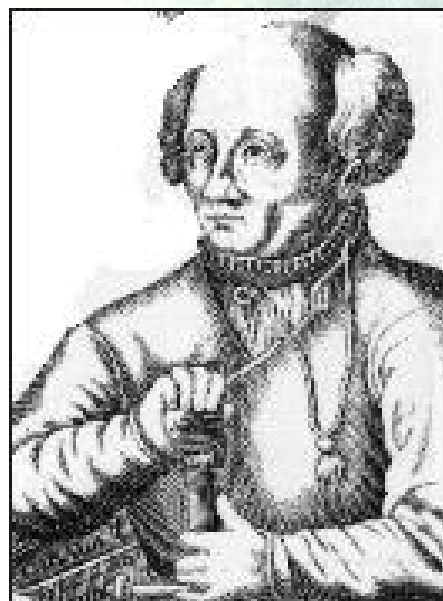
Flamel-Heinst et Para-Grüber, deux grands théoriciens de la Focalisation